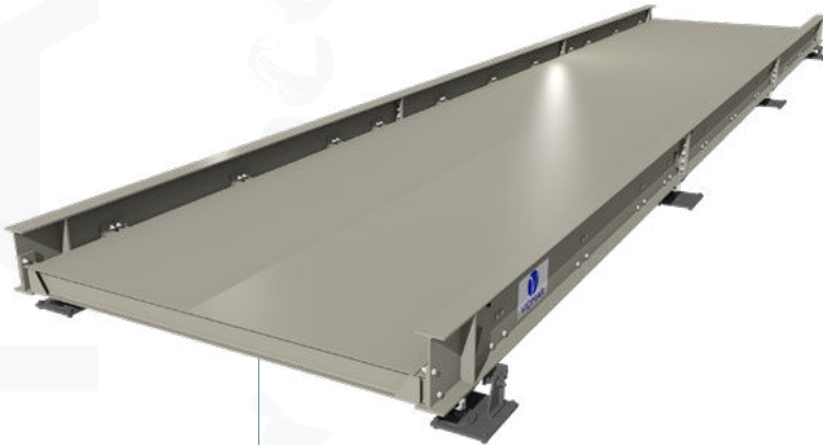
BÁSCULA PARA CAMIONES DE VIGA METÁLICA