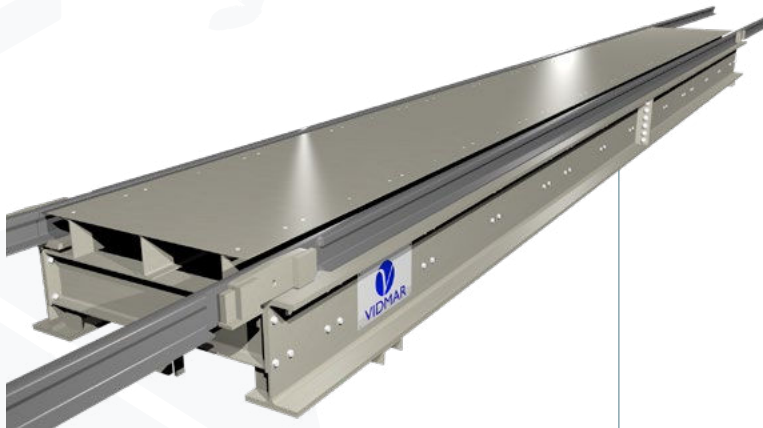
BÁSCULA PARA FERROCARRILES