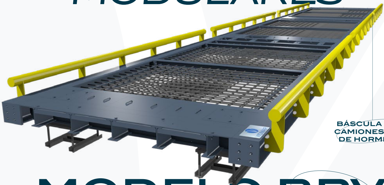
BÁSCULA PARA CAMIONES LOSA DE HORMIGÓN