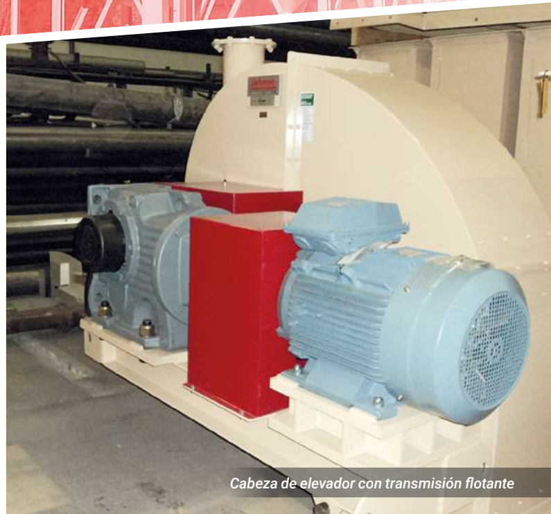
Cabeza de elevador con transmisión flotante