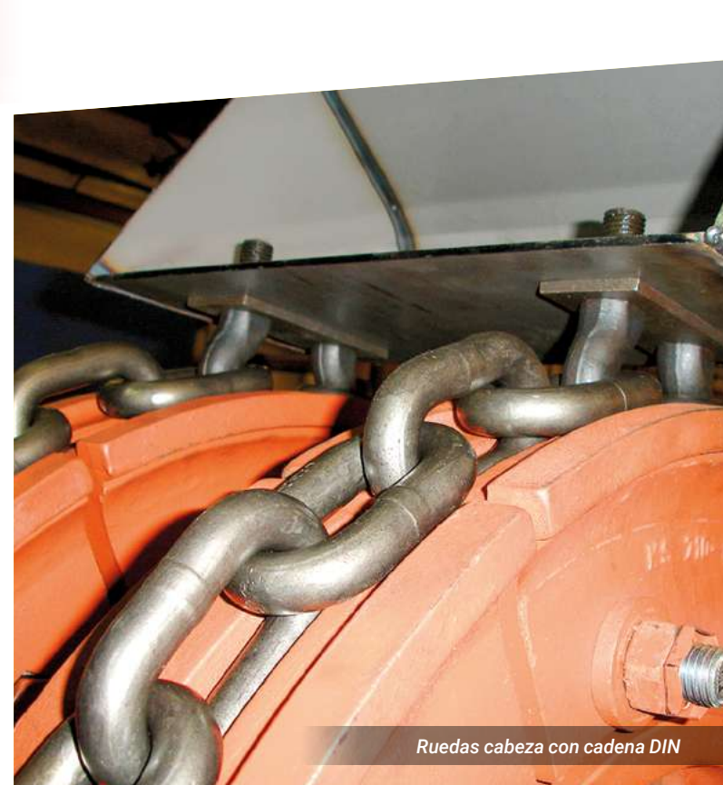
Ruedas cabeza con cadena DIN

En SINFIMASA ofrecemos una amplia gama de elevadores de cangilones, adaptados a sus necesidades de rendimiento y tipo de material. Consulte su proyecto y le brindaremos la solución ideal.