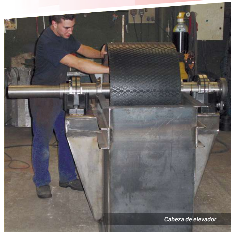
Cabeza de elevador