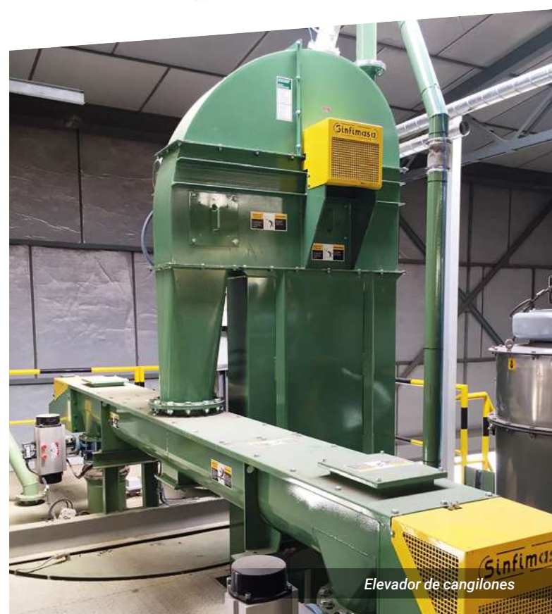
Elevador de cangilones