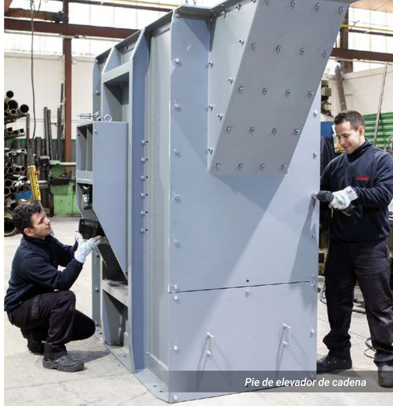
Pie de elevador de cadena