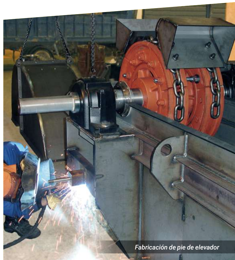
Fabricación de pie de elevador