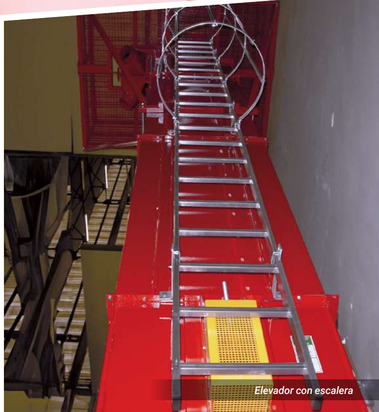
Elevador con escalera