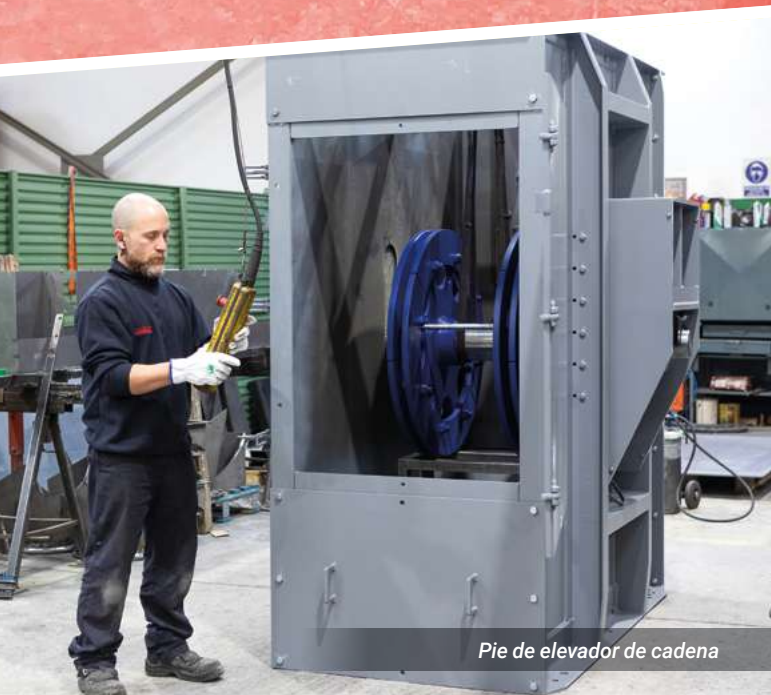
Pie de elevador de cadena