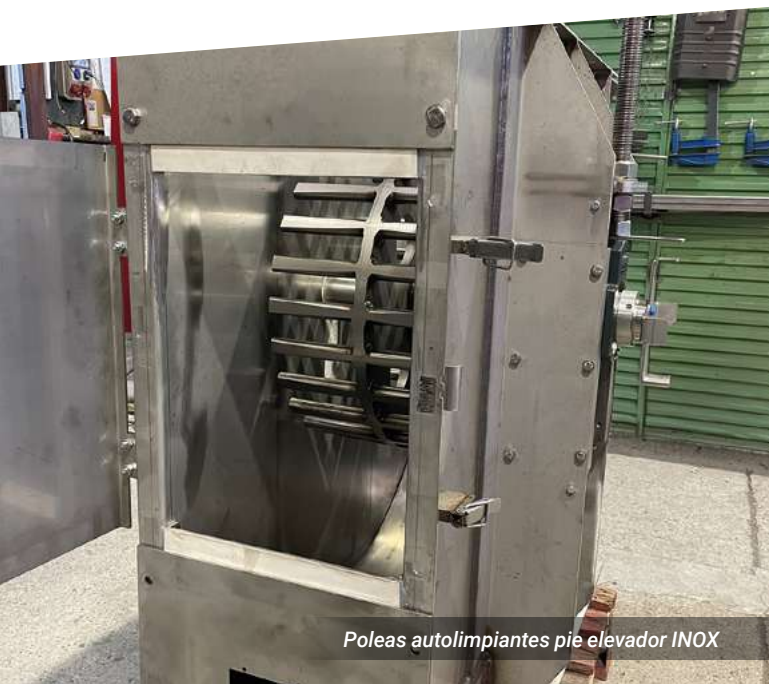
Poleas autolimpiantes pie elevador INOX