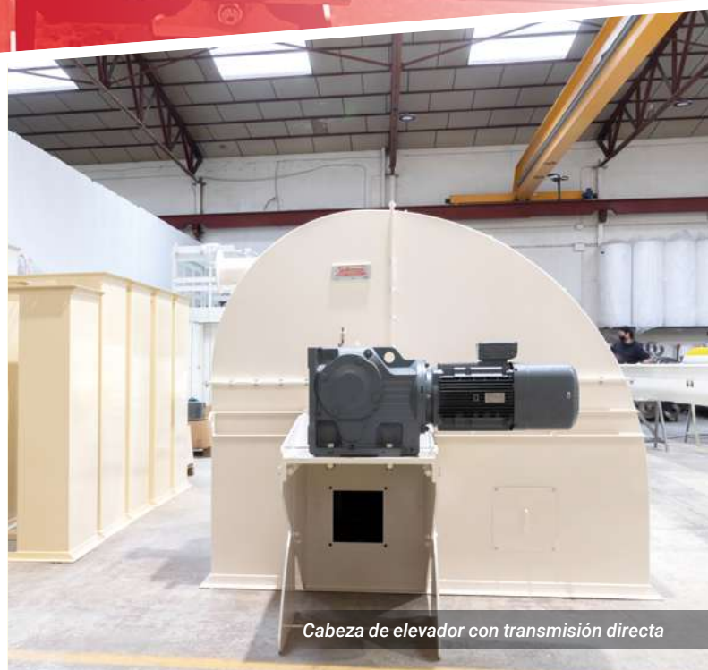
Cabeza de elevador con transmisión directa