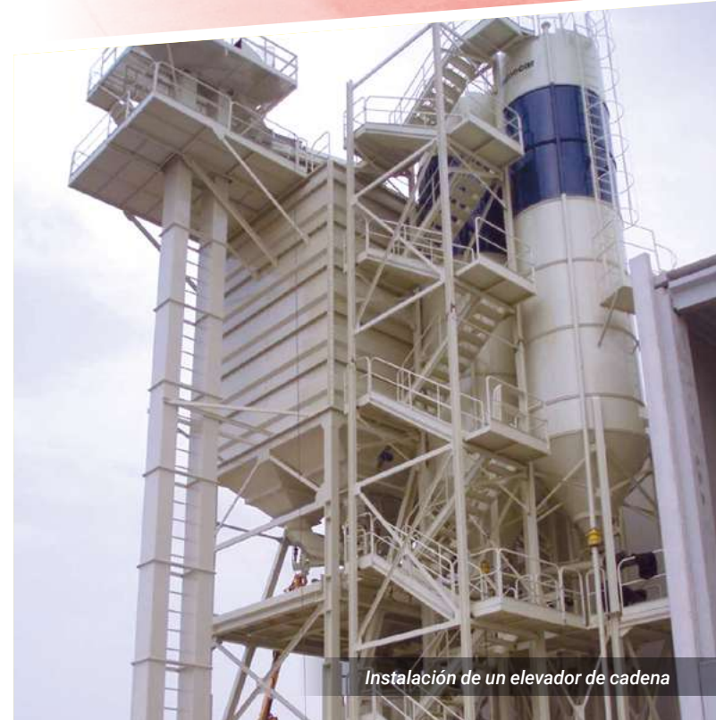
Instalación de un elevador de cadena