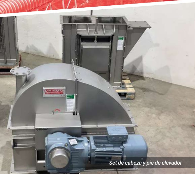
Set de cabeza y pie de elevador