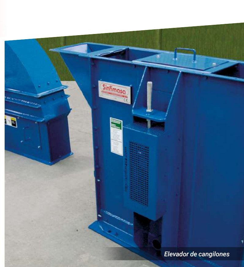
Elevador de cangilones