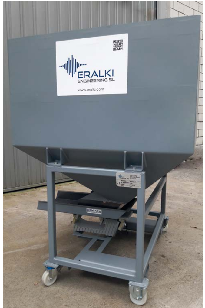
Tolva con dosificador vibrante