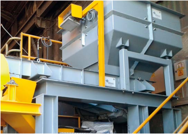
Alimentador vibrante electromagnético