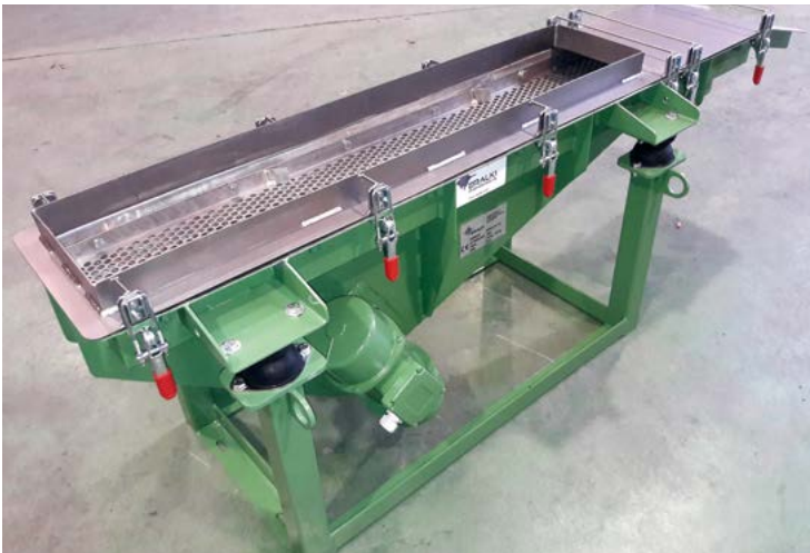
Transportador criba vibrante