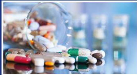
» FARMACIA & COSMÉTICA