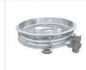
Descarga silos, tolvas