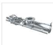
Transportadores sin fin