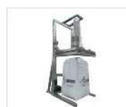
Carga bigbags, bidones