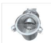
Dosificación y Pesada