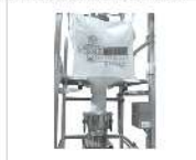
Descarga bigbags, sacos, containers