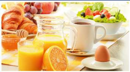
» ALIMENTACIÓN & BEBIDAS