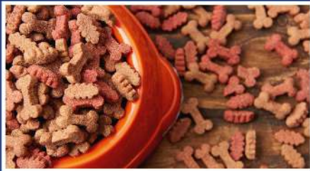
» ALIMENTACIÓN ANIMAL