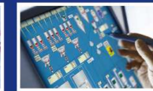
» AUTOMATIZACIÓN Y CONTROL