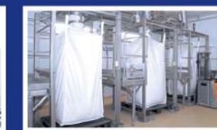
» DESCARGA DE SACOS Y BIGBAGS