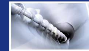
» MEZCLA Y SECADO