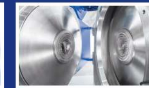
» PROCESADO DE PARTÍCULAS