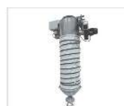
Carga camiones, vagones