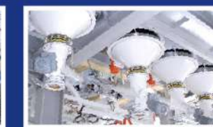
» DOSIFICACIÓN Y PESADA