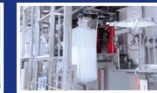
» CARGA DE BIGBAGS Y CAMIONES