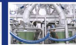
» TRANSPORTE NEUMÁTICO