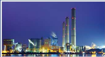
» MEDIO AMBIENTE & ENERGÍA