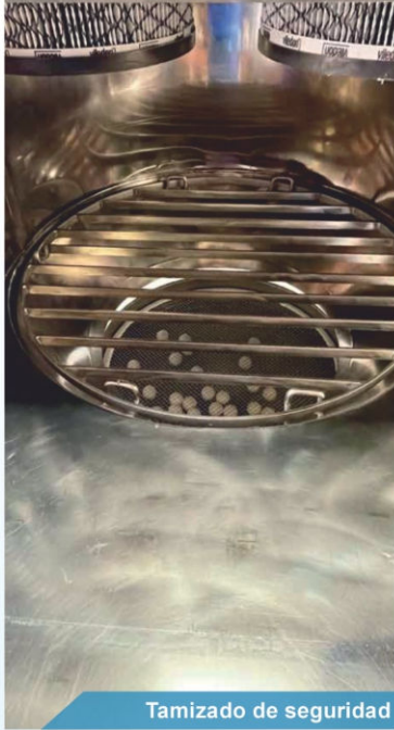
Tamizado de seguridad