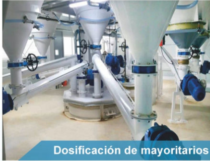
Dosificación de mayoritarios