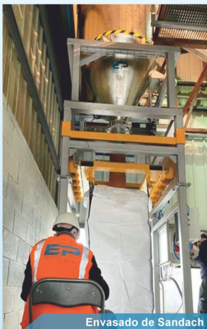
Envasado de Sandach