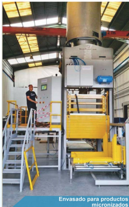
Envasado para productos micronizados