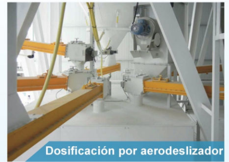
Dosificación por aerodeslizador