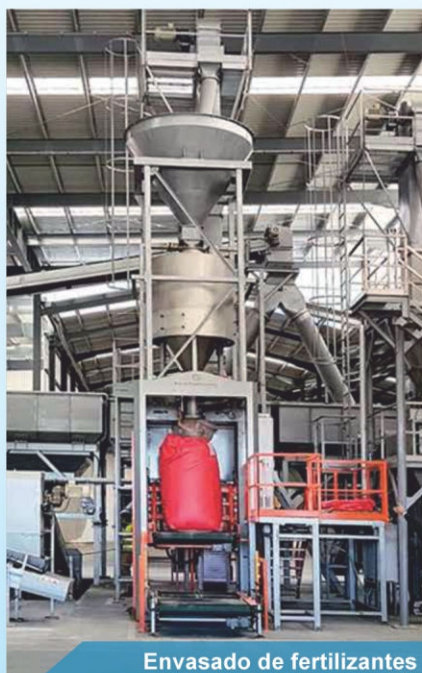
Envasado de fertilizantes