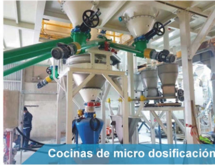
Cocinas de micro dosificación