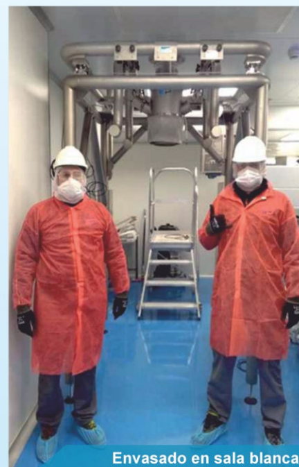
Envasado en sala blanca