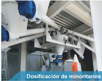
Dosificación de minoritarios