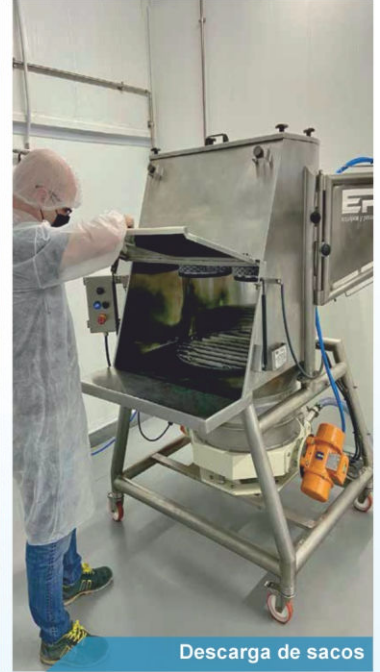
Descarga de sacos