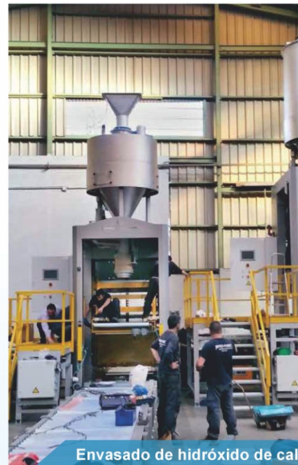
Envasado de hidróxido de cal