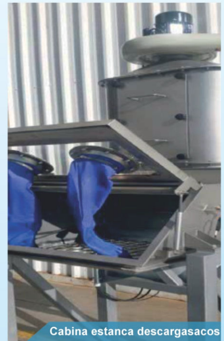
Cabina estanca descargasacos