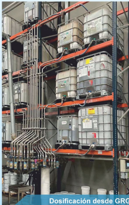
Dosificación desde GRG