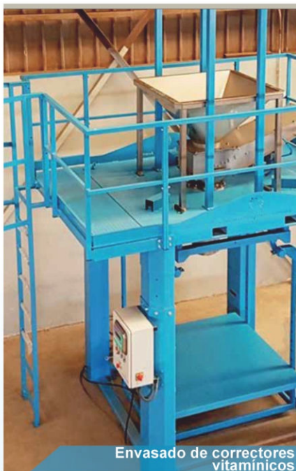
Envasado de correctores vitamínicos