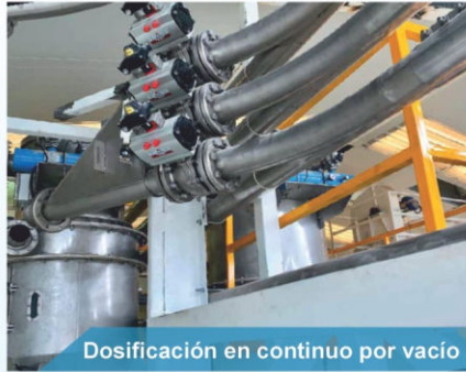
Dosificación en continuo por vacío