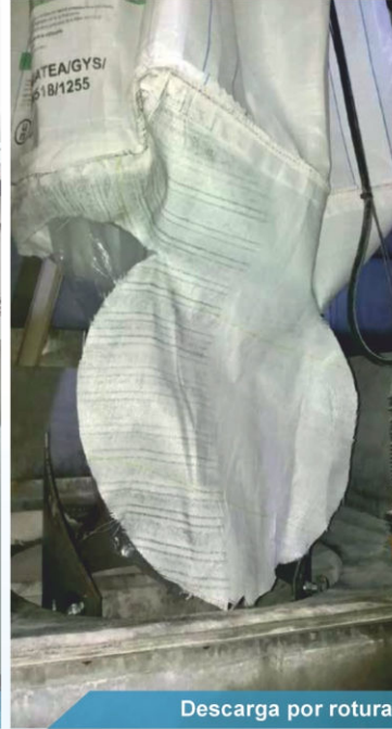
Descarga por rotura