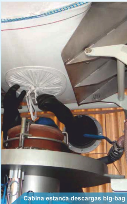
Cabina estanca descargas big-bag